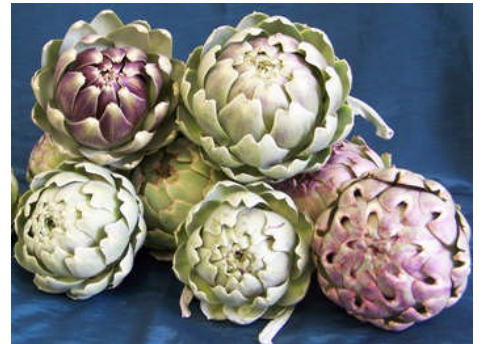
Artisiogau newydd eu cynaeafu

Mae angen cynaeafu'r ffrwythau'n rheolaidd gan eu bod orau yn ifanc (er bod courgettes hŷn yn rhagorol ar gyfer eu stwffio).