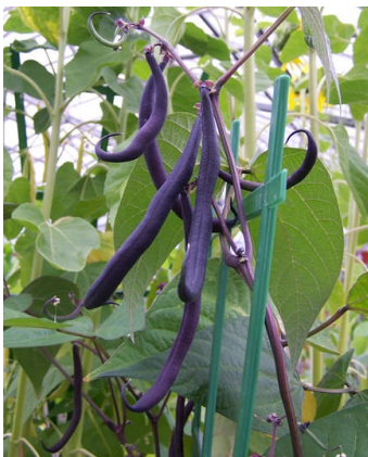
Ffa Teepee porffor

Eleni fe wnaethom dyfu dau fath o ffa porffor: 'Purple Teepee' a 'Royalty'. I gyd-fynd â'r rhain fe wnaethom hefyd dyfu dau fath o ffa melyn: 'Mont d'Or Golden Butter' a 'Sungold'. Mae'r holl fathau a dyfwyd ar gael o gatalogau hadau da ac o ganolfannau garddio.