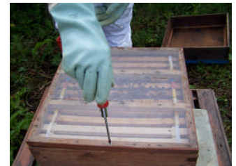
Cwch gwenyn CALU yn cyrraedd

Gyda'r llecynnau coedwig o amgylch, perllan Henfaes gerllaw, a phlanhigion lafant a digon o ffrwythau a llysiau eraill heb fod ymhell, rydym yn edrych ymlaen at dymor cynaeafu'r mêl!