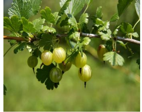
gyfer pwddin, a'r 'Careless' poblogaidd.

Mae gwsberis yn adnabyddus iawn i'r cyhoedd ac yn addas at sawl pwrpas yn y gegin. Mae mathau gwyrdd i'w coginio, megis 'Invicta' a 'Careless', yn hawdd iawn eu tyfu ac yn cynhyrchu'n dda. Mae mathau coch yn llai cyffredin, ond mae iddynt werth fel newyddbethau a gallant fod yn gostus. Yn Henfaes, mae CALU wedi plannu dau fath o wsberis, sef 'Whinham's Industry', sy'n addas ar