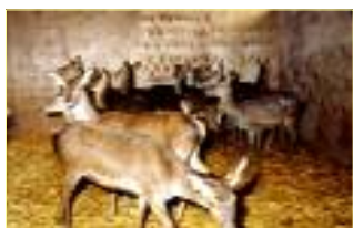
Ffig 2. Ewigod dan do