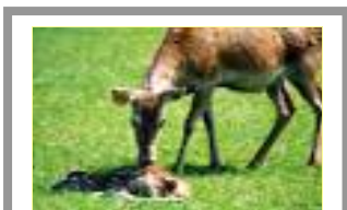
Ffig 3. Llo newyddanedig

Ar ffermydd tir isel a reolir yn dda, dylai lloi a enir ym Mehefin ennill rhyw 350-400g y dydd yn ystod cyfnod yr haf tra byddant yn sugno tethi'r fam. Cânt eu diddyfnu yn 12-14 wythnos oed, a dylent bwyso 40-45kg.