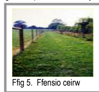
Ffig 5. Ffensio ceirw

Ffensio diogel yw'r gost hanfodol gyntaf, ac mae'n gost o bwys mewn ffermio ceirw. Mae angen i ffensys y ffiniau fod yn 1.9m o uchder gyda ffensio uchel dynno llorweddol a fertigol. I wella diogelwch, efallai y bydd angen gwifren atred ychwanegol. Mae ceirw yn cael braw yn rhwydd, ac mae angen cyfleusterau trin diogel. Mae gwasgfa yn hollbwysig i ffrwyno ceirw. Mae lloi sydd wedi'u diddyfnu yn perfformio'n well os cânt eu cadw dan do yn ystod y gaeaf ac, ar gyfraddau stocio uchel, efallai y byddai'n werth chweil cadw stoc mewn oed dan do hefyd. Gellir addasu llawer o adeiladau a geir eisoes ar fferm i gadw ceirw.