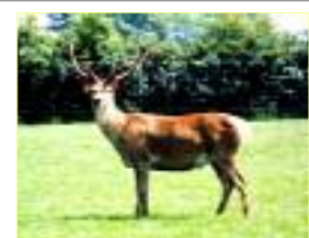
Ffig 1. Hydd aeddfed

Mae ceirw mewn oed yn mynd trwy gyfnod o fwyta'n ysgafn yng nghanol y gaeaf, pryd y byddant yn colli pwysau'n naturiol. Felly, mae'n bwysig fod ewigod mewn cyflwr da ar ddechrau'r gaeaf. Os cedwir ewigod dan do ym mis Rhagfyr, gellir rhoi amryw o ddognau sylfaenol iddynt, yn cynnwys gwellt, gwair, betys porthiant a belen silwair. Yn ôl ymchwil a wnaethpwyd yn ADAS Rosemaund, Swydd Henffordd, cafwyd y gellir bwydo ewigod aeddfed a gedwir mewn cyflwr da ar 11 MJ ME / y dydd yn ystod y gaeaf heb amharu wedyn arnynt hwy nac ar eu lloi. Gellir gwneud hyn â belen silwair fawr heb unrhyw ychwanegiad, neu â gwellt haidd ad libitum , ynghyd â phryd ffa soia 270g. Fodd bynnag, yn ystod eu beichiogrwydd cyntaf neu eu hail feichiogrwydd, mae ar ewigod ifainc angen o leiaf 15 MJ ME / y dydd yn ystod cyfnod y gaeaf.