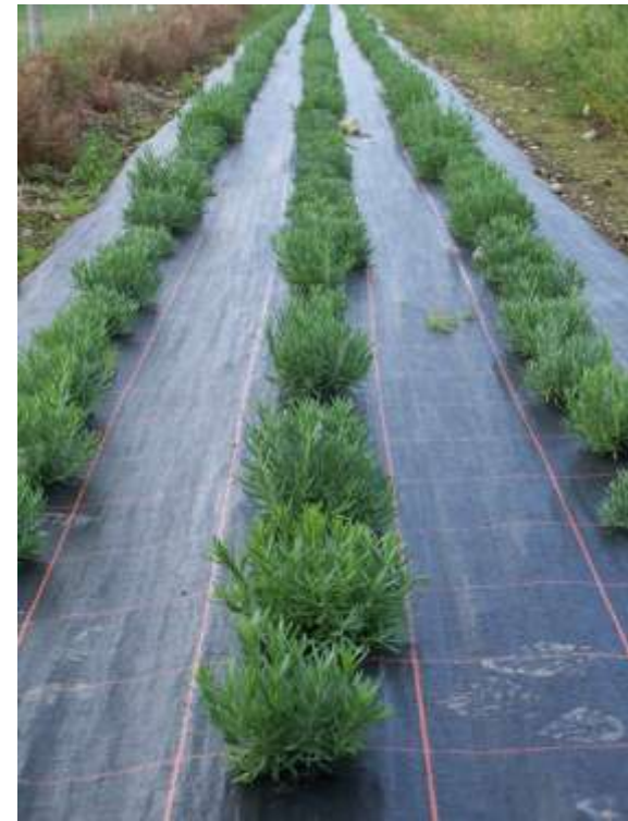
22 nd Awst 2008 (Hidcote)